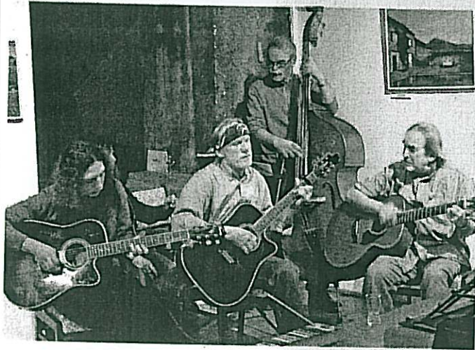
ZAHÁJENÍ výstavy doprovázelo vystoupení kapely Podobní zvěři, jejíž členové dříve spolupracovali s Wabi Ryvolou.